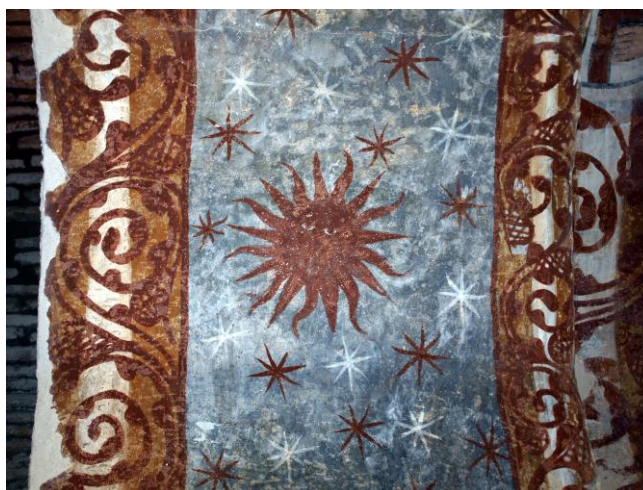
Santa Comba Bande