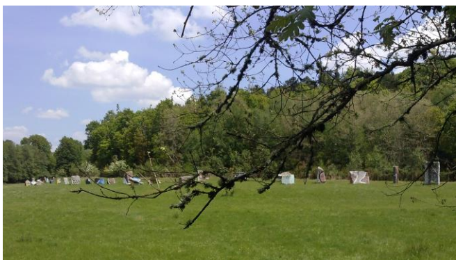
O Rexo (Allariz)

2. Onde está este aliñamento de pedras coloridas da provincia de Ourense? E este sol pintado nunha igrexa da mesma provincia?