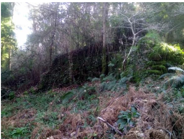
Aldea da Fraga

2. Como se chama a aldea abandonada do termo municipal de Vigo da foto da esquerda? Nome da igrexa española da imaxe da dereita, que ten que ver cos xesuítas.