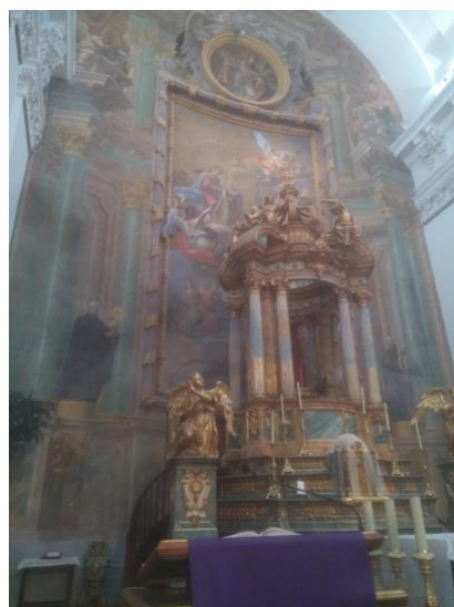
Igrexa de San Ildefonso en Toledo