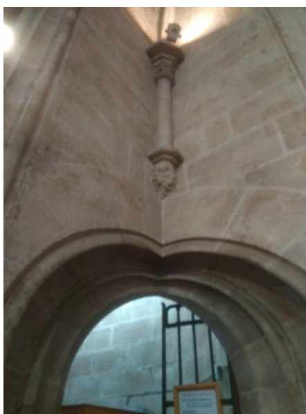
Porta de acceso ao Miguelete