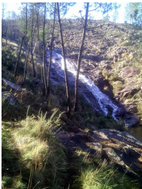
Fervenza do Freixo

2. Que salto de auga vemos na imaxe da esquerda? (termo municipal de Vigo). A que torre da acceso esta curiosa porta da foto da dereita (territorio español)?