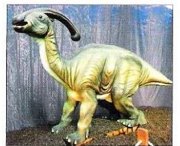
El Parasaurolophus. // Fdv

El dinosaurio más célebre y peligroso se deja fotografiar en Vigo con los más pequeños